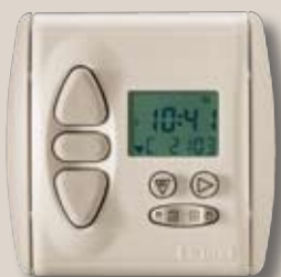
Somfy Funk-Zeitschaltuhr Chronis RTS smart