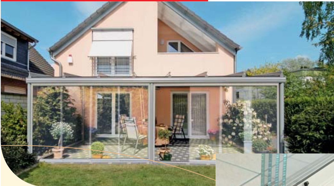
Mit einem Handgriff zu schließen: Ganzglas-Schiebe-Tür w17-c ▲ ►