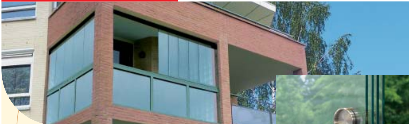
▲ Ganzglas-Schiebe-Tür als Balkonverglasung mit komfortabler Bedienung