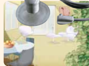
Jetzt scheint die Sonne intensiv. Der Sensor meldet grelles Licht ...