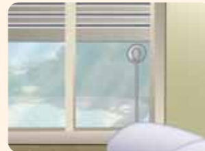
... und fährt den Rollladen auf die eingestellte Höhe.