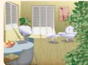
In Ihrer Wohnung ist wieder alles im grünen Bereich.