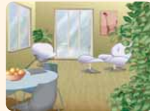
Bis zum Mittag herrschen optimale Lichtverhältnisse.