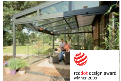
▼ Die Glasoase® aus den weinor Terrassenwelten