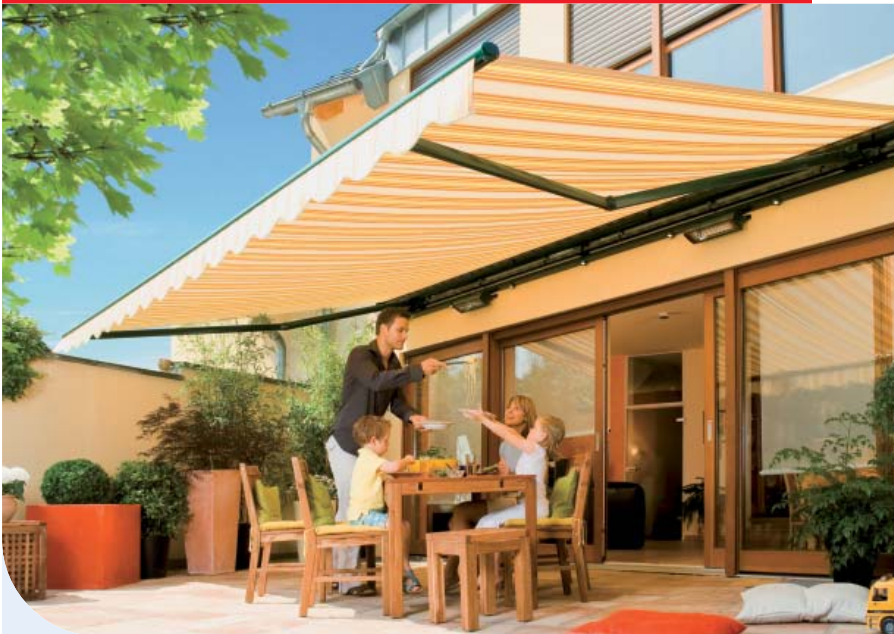
▲ weinor Markisen