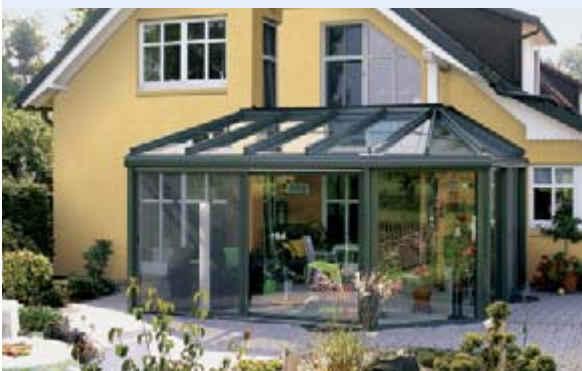
▲ weinor Wintergärten

Wie auch immer Sie Ihre Terrasse nutzen möchten, weinor hat das geeignete Produkt für Sie – Markise, Terrassendach, Glasoase® und Wintergarten